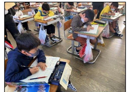
NO.269 2022年10月 大分市立川添小学校