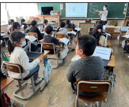
NO.270 2022年10月 大分市立川添小学校