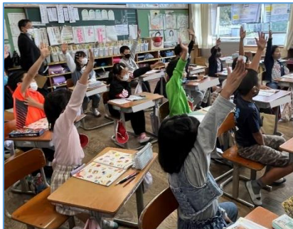
NO.268 2022年10月 大分市立川添小学校