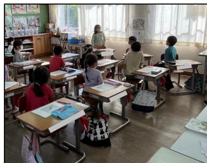
NO.265 2022年10月 大分市立川添小学校