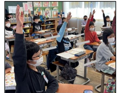
NO.267 2022年10月 大分市立川添小学校

今後は、子どもどうしの学び合いを多く取り入れることで、挙手する子どもだけでなく全員が説明に参加できるような工夫をされると良いと思います。その際は、教師は全体を俯瞰的に見ることで、それぞれのグループの良さや進捗について形成的な評価を行い、次への活動につなげると良いと思いました。