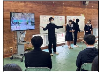
NO.310 2022年10月 臼杵市立西中学校

教職員の意識を変え、生徒達を信じて任せていくことで、生徒達が作成した「西中学習スイッチ」を実践することをおして、自らが授業の質を高めようとする姿は見事でした！このような本校の研究や実践から、これからも目が離せません！！私も学びます！！ありがとうございました。