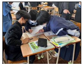
NO.316 2022年10月 臼杵市立西中学校

仲間と共に学ぶと楽しくなる。楽しくなるとやる気になる。やる気がでると学びが深くなる。