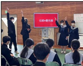
NO.311 2022年10月 臼杵市立西中学校

課題をもち、調べ、まとめ、そして、自分たちが考えたことを相手に届くように伝えるのだ。