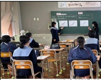
NO.317 2022年10月 臼杵市立西中学校

自分の考えたこと、疑問に思ったことを出し合う。出された考えをみんなで共有し解決する。