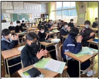
NO.318 2022年10月 臼杵市立西中学校