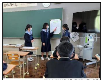
NO.315 2022年10月 臼杵市立西中学校