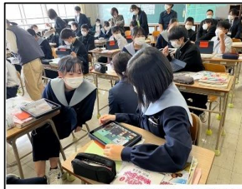
NO.314 2022年10月 臼杵市立西中学校