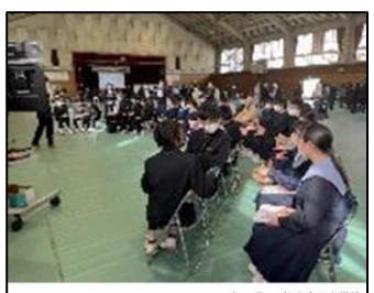
NO.312 2022年10月 臼杵市立西中学校