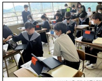
NO.313 2022年10月 臼杵市立西中学校