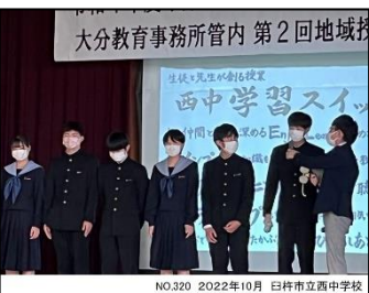
NO.320 2022年10月 臼杵市立西中学校