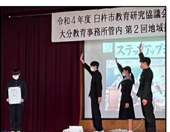
NO.319 2022年10月 臼杵市立西中学校