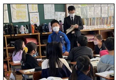
NO.410 2022年11月 大分市立東大分小学校

発表をするのは勇気がいる。でも、聴いてくれる友達がいるから、手を挙げることができる。