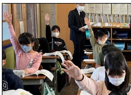
NO.412 2022年11月 大分市立東大分小学校