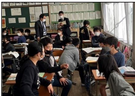
NO.411 2022年11月 大分市立東大分小学校