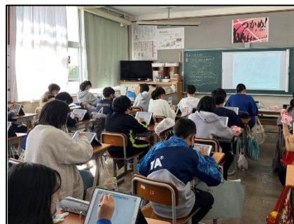
NO.498 2022年11月 大分市立豊府小学校

学ぶことは、まねることから始まる。素直な気持ちで、先生の話を聞く。そして、考える。