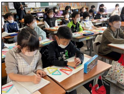
NO.496 2022年11月 大分市立豊府小学校