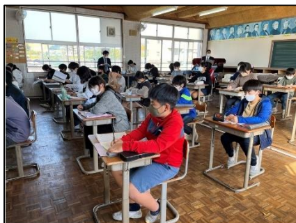
NO.497 2022年11月 大分市立豊府小学校