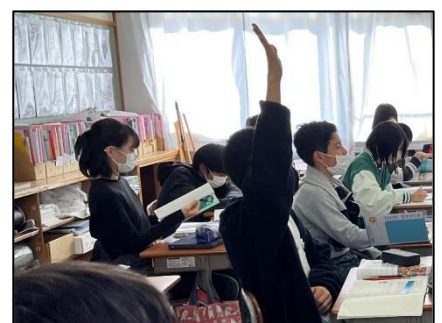
NO.495 2022年11月 大分市立豊府小学校