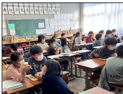
NO.494 2022年11月 大分市立豊府小学校

まずは自分で考える。次に、友達と意見を出し合う。共通点や相違点がわかる。新たな課題が見つかる。協働的に解決する。