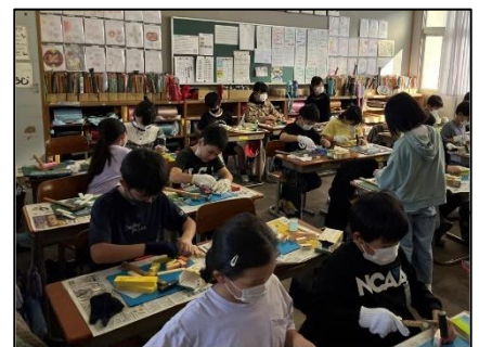
NO.499 2022年11月 大分市立豊府小学校