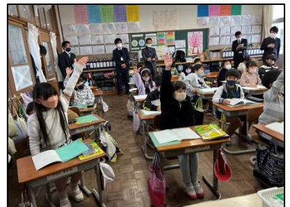
NO.531 2022年12月 大分市立明治小学校

挙手の効果 指先まで集中して挙手をする、自然に背筋が伸び顔が上がる。やる気の姿勢が、周りにもいい影響を与える。