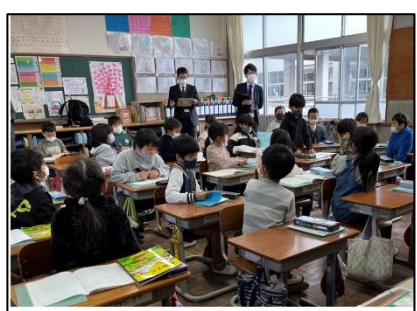
NO.532 2022年12月 大分市立明治小学校

発表できる 安心して自分の思いを言えるのは、共感的に聴いてくれる友達に囲まれているから。