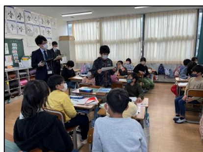
NO.530 2022年12月 大分市立明治小学校

拍手の思い 拍手から「すごい」「がんばれ」「私と同じだよ」「気がつかなかったよ」「頑張ったね」……優しいメッセージが伝わる。