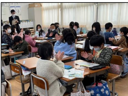
NO.529 2022年12月 大分市立明治小学校

拍手の思い 拍手から「すごい」「がんばれ」「私と同じだよ」「気がつかなかったよ」「頑張ったね」……優しいメッセージが伝わる。