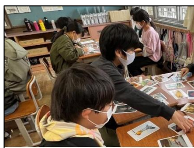
NO.522 2022年11月 大分市立明野東小学校

「すごい」「がんばれ」「私と同じだ」「よくやったよ」……拍手には、相手を励ますメッセージがある。だから、共に頑張れる。