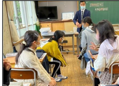
NO.519 2022年11月 大分市立明野東小学校

共感的に聴いてくれる友達がいる。応援してくれる友達がいる。だから、前に出て発表ができる。