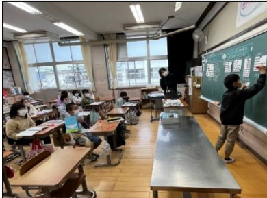
NO.520 2022年11月 大分市立明野東小学校