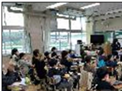
NO.523 2022年11月 大分市立明野東小学校

最初からうまくはいかない。何度も繰り返し行うことでできるようになる。だから、失敗は無い。すべてが経験だ。