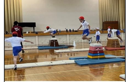
NO.518 2022年11月 大分市立明野東小学校

自分と友達の考えを比較する。共通点と相違点が明確になる。そこから、新たな課題が見つかる。やる気になる。