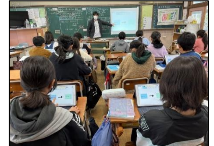
NO.521 2022年11月 大分市立明野東小学校

相手は何を考えているのかな？ どうしてそう思ったのかな？多様化する、答えのない時代だからこそ、想像する力は大切だ。