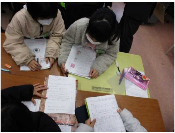
総合的な学習の時間「渡町台お店マップで地域の人を笑顔にしよう」 ・お店マップに載せる紹介文を比較したり関連付けたりして、よりよいマップになるように話し合う