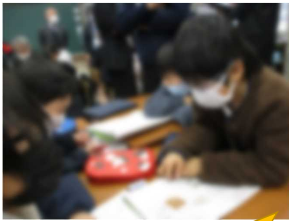
伝えたいことを絞りたい！