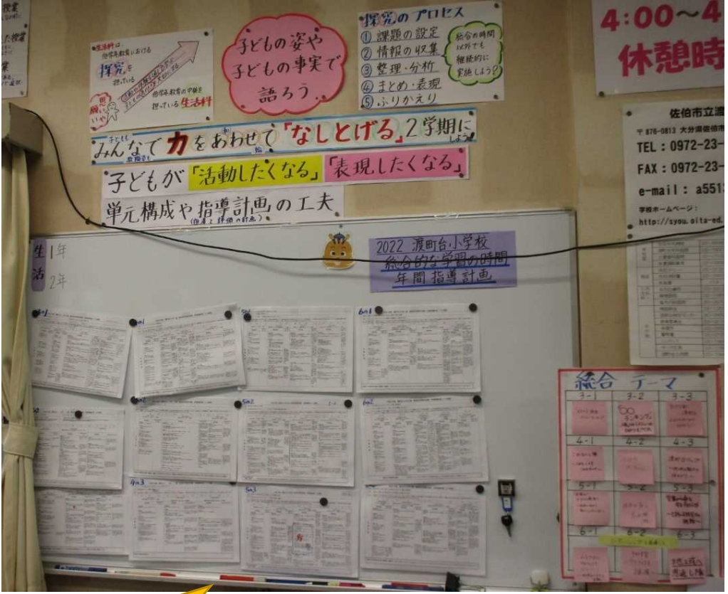
単元計画表を掲示して意識付け

渡町台小学校では、佐伯市学力向上実践研究事業に係る研究指定を受け、「子どもが『活動したくなる』『表現したくなる』単元構成と指導計画（指導と評価の計画）の工夫～生活科・総合的な学習の時間を中心として～」を研究主題に掲げ、生活科・総合的な学習の時間の実践研究に取り組んでいる。