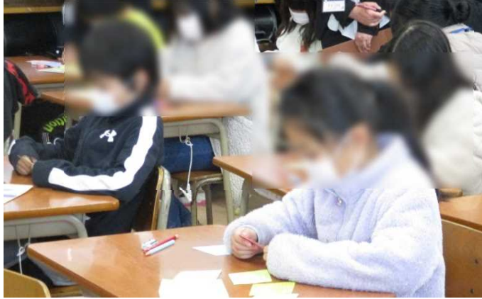
生活科内容（9）「自分たんけん～自分の成長を見付けよう～」 ・友だちからもらった「きらきらカード」を読んで、自分のよさや成長に気付く