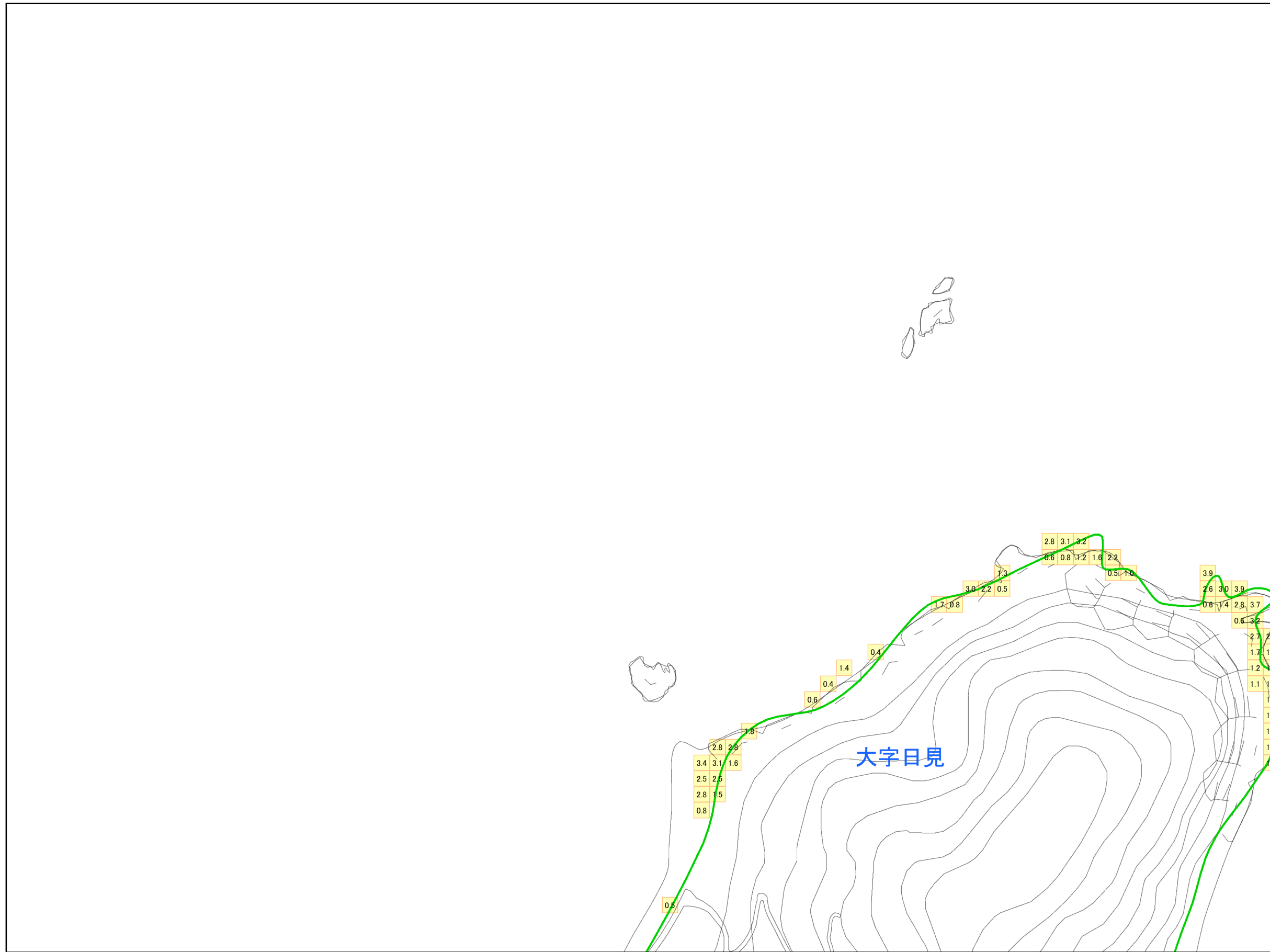
津波災害警戒区域 区域図