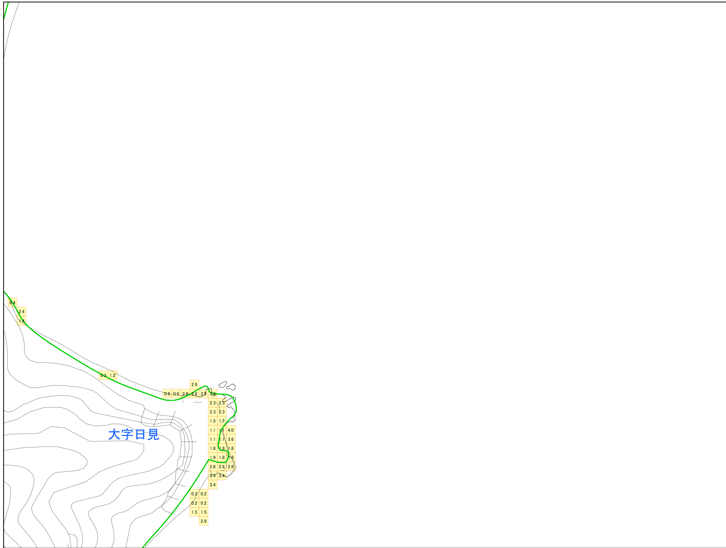
津波災害警戒区域 区域図