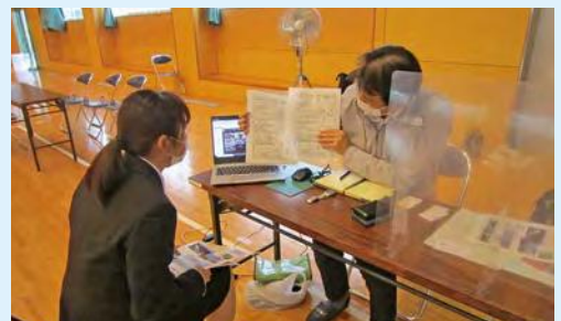
就職相談会の個別相談

進学 大分県佐伯高等技術専門学校 別府溝部学園短期大学 愛媛大学農学部3年次編入 タキイ研究農場付属園芸専門学校