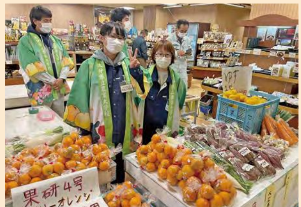
新鮮な野菜や果物いかがですか!

本校の学生が丹精込めてつくった自信の野菜や果物を多くの人に食べてもらおうと、大分市の「大分いこいの広場」で開催された「大分マルシェ」やトキハ明野アクロスタウンにおいて出張販売を行いました。各コースから出品される野菜や花、果物はどれも新鮮で価格も安いと好評で、開店と同時に長い列ができ、売り切れになってしまうものもありました。