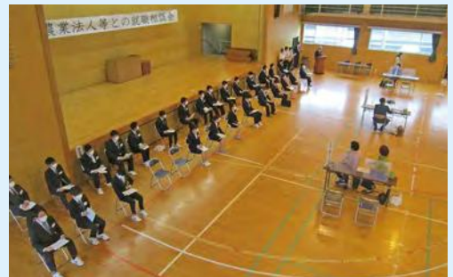
就職相談会 開会式