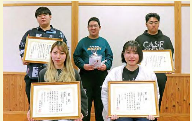
受賞者のみなさん