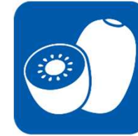
キウイフルーツ kiwi fruit