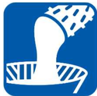
やまいも wild yam