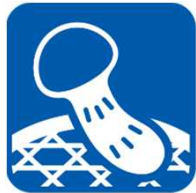
まつたけ matsutake mushroom