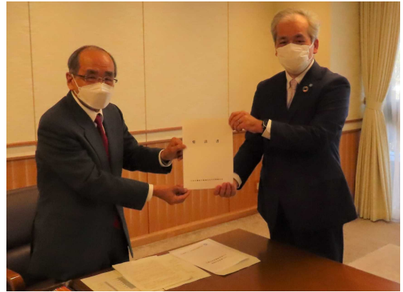
(左)広瀬勝貞大分県知事 (右)石本健二連合大分会長

石本会長はあいさつの中で、2023春季生活闘争に関し、「賃上げに向けた今の機運の高まりを、中小企業も含めた中でしっかり結果に繋げていかなければならないと考えている。」と述べ、広瀬知事に対し、6項目からなる要請書を手渡すとともに、最低賃金の引き上げに向けた取組への協力を求めました。