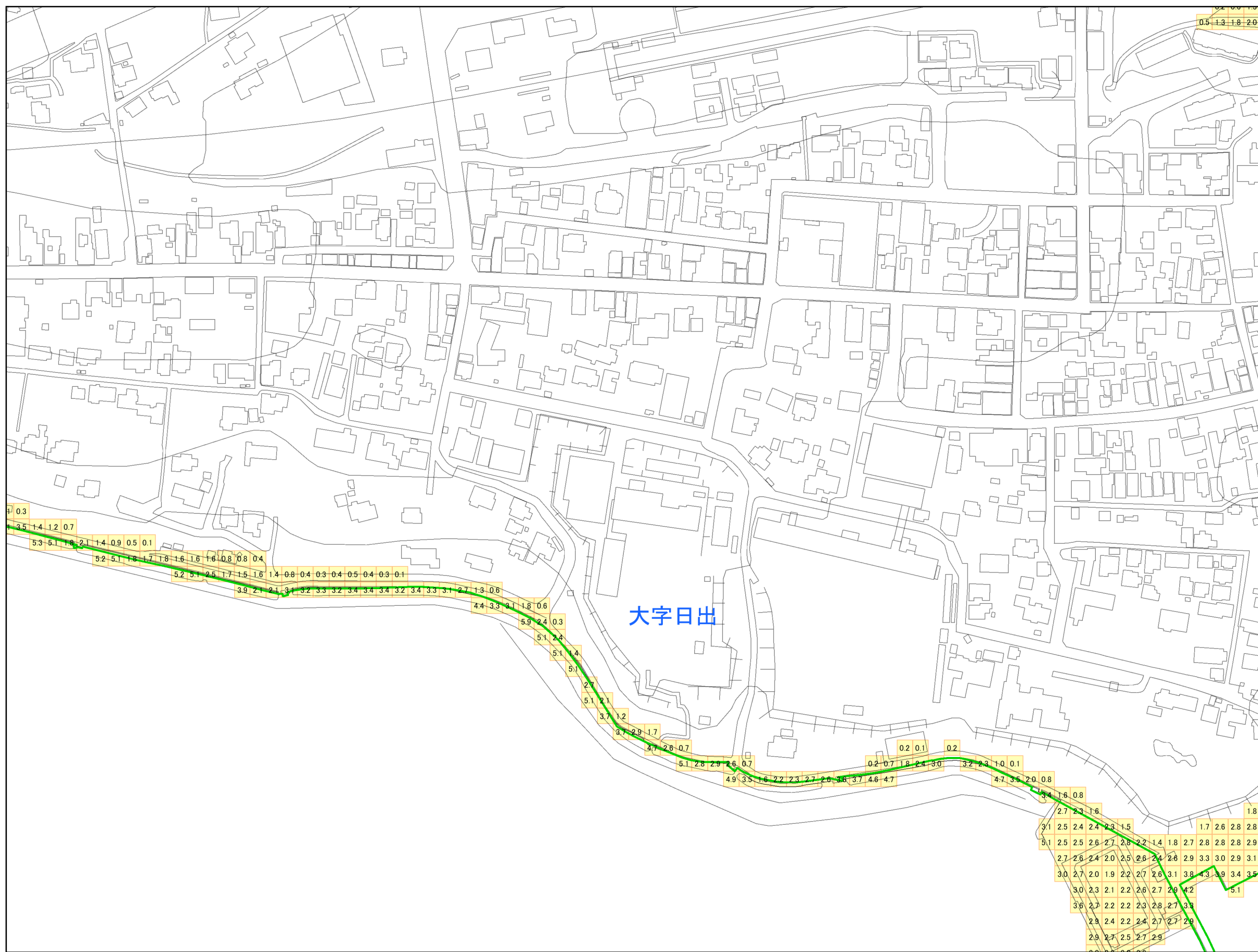
津波災害警戒区域 区域図