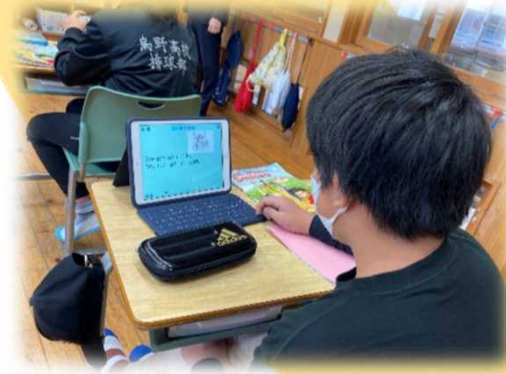
学習した表現を活用して 身近な人物クイズをつくり紹介し合う