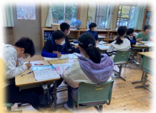
伴って変わる2つの量について、 協働しながら表に整理する