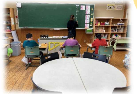
協働して学習することのできる スペースを確保