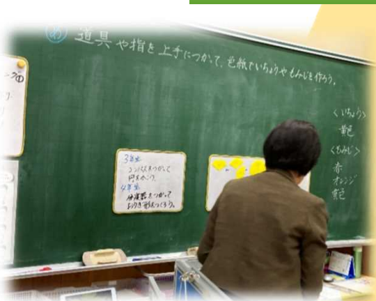
算数で学んだことを使って「いちよう」を作る ことについて、自分たちでめあてを立てる