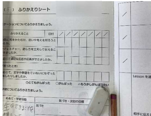
単元の学びを振り返るシートの活用