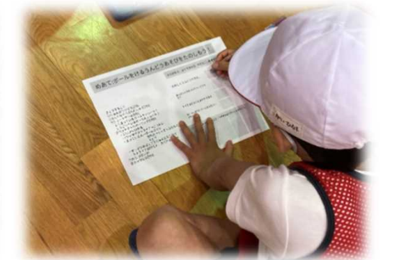
振り返りの視点に基づいて、自分たちの ボールけりゲームを振り返る(低学年)