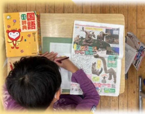
新聞や辞書、漢字ドリル等から共通する 「へん」のある漢字を見付ける