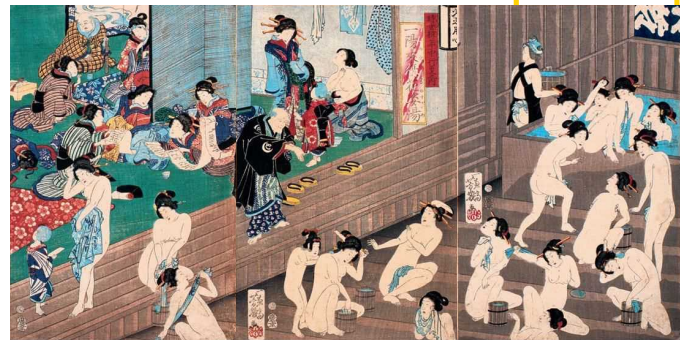
落合芳幾《時世粧年中行事之内 一隔来復花姿湯》 1868年 神戸市立博物館蔵 ※展示期間:12月20日(水)~1月21日(日)

人類史上に輝く繁栄を誇った古代ローマ。なかでも日本人が深い関心をよせるものの一つがテルマエ(公共浴場)であり、ヤマザキマリ氏による漫画『テルマエ・ロマエ』はテルマエへの親近感を一層高めました。本展では、絵画・彫刻・考古遺物といった100件以上の作品や映像、模型などの展示品により、テルマエを愛した古代ローマの人々の生活を身近に感じていただくことができます。また、『テルマエ・ロマエ』の主人公ルシウスが案内人となり、古代ローマのテルマエとともに、日本の入浴文化も紹介します。ルシウスが浴場をとおして日本とローマを往復したように、それぞれの入浴文化を体験することのできる機会となるでしょう。