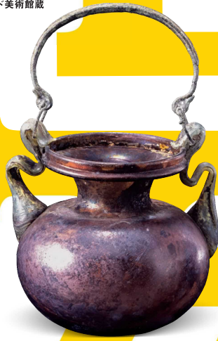
《銅製把手付ガラス壺》3-4世紀 MIHO MUSEUM蔵