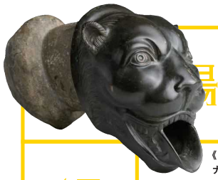
《ライオン頭部の吐水口》1世紀 ナポリ国立考古学博物館蔵