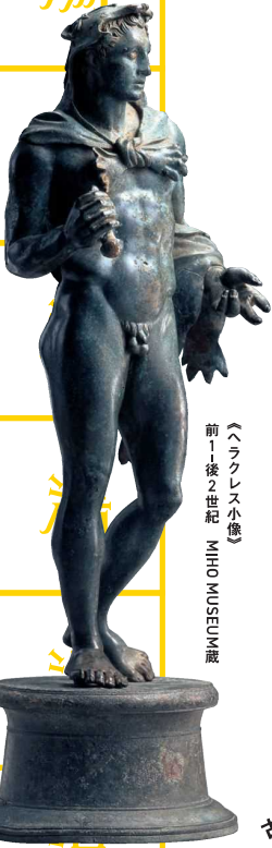
《ラクレス小像》 前1-後2世紀 MIHO MUSEUM 蔵