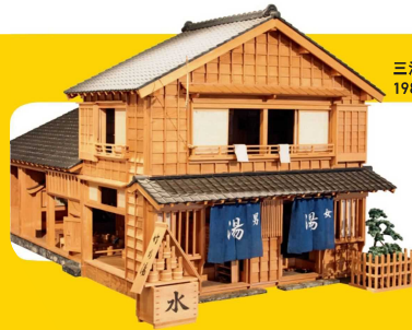
三浦宏《湯屋模型》 1980年代 個人蔵