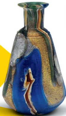
《ゴールドバンド装飾瓶》1世紀 平山郁夫シルクロード美術館蔵