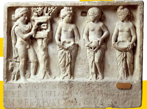
《アポロとニンフへの奉納浮彫》2世紀 ナポリ国立考古学博物館蔵