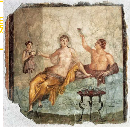
《ヘタラ(遊女)のいる湯》 1世紀 ナポリ国立考古学博物館蔵