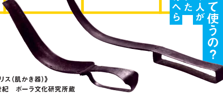
《ストリギリス(肌かき器)》 前3-前1世紀 ポーラ文化研究所蔵