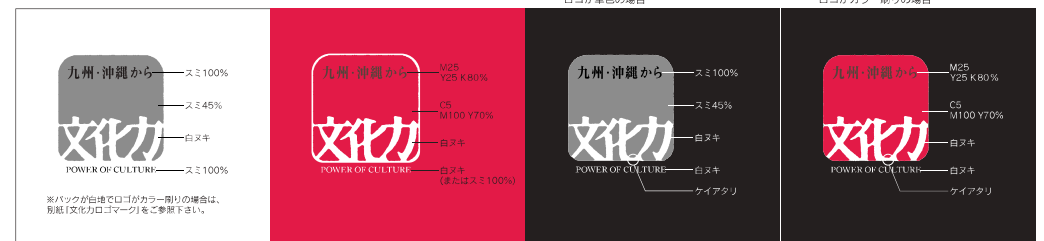
(C)バックがカラー(スミベタ含む)で ロゴがカラー(黒)の場合