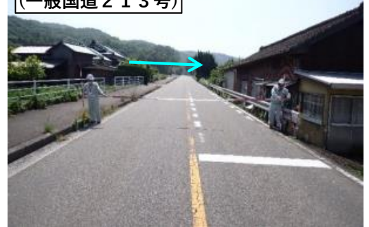
保全対象 (一般国道213号)