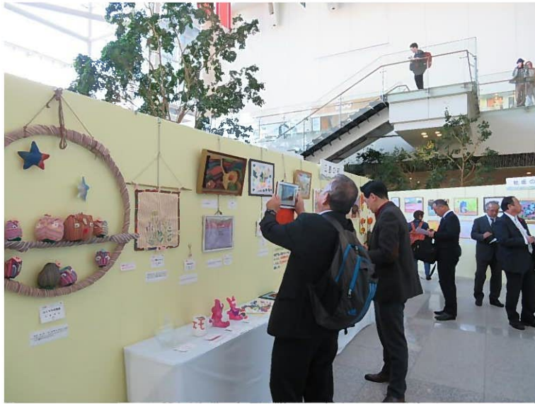
【 おおいた障がい者芸術文化センター企画展 】