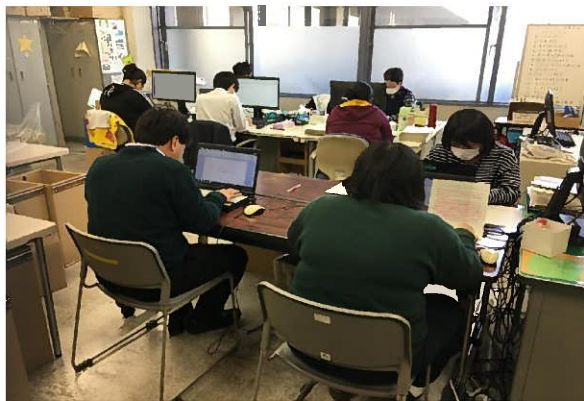
【大分県庁ワークセンター】