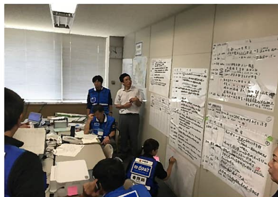
【大分県 DPAT の訓練】