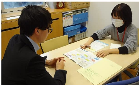
【障害者就業・生活支援センターでの相談支援】