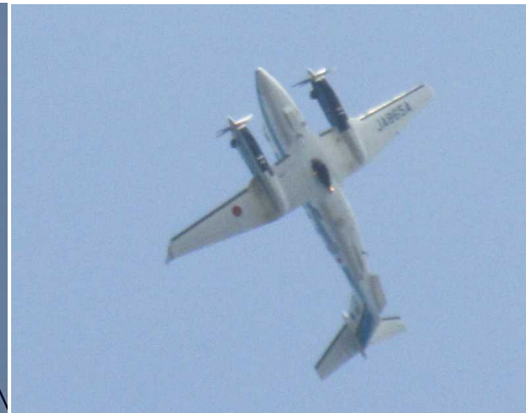
○サイン旗活用訓練及び災害情報収集伝達訓練（空）