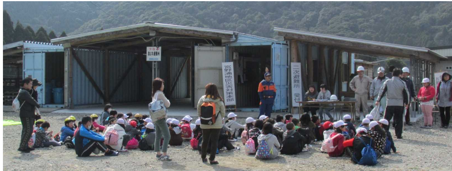
○避難広報訓練・避難誘導訓練及び住民避難訓練