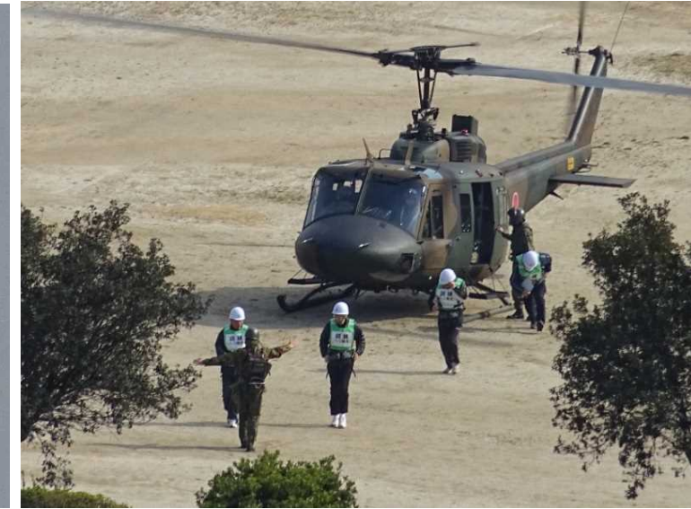
○孤立地区からのヘリによる避難住民移送訓練