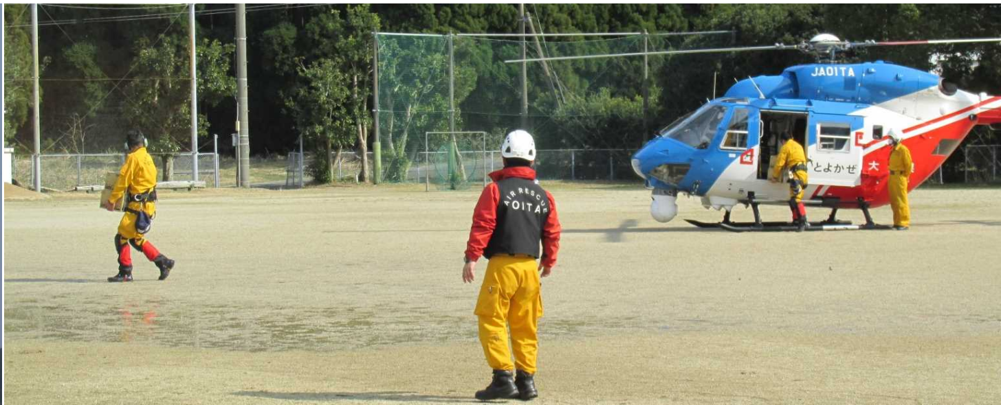
○孤立地区へのヘリによる物資搬送訓練