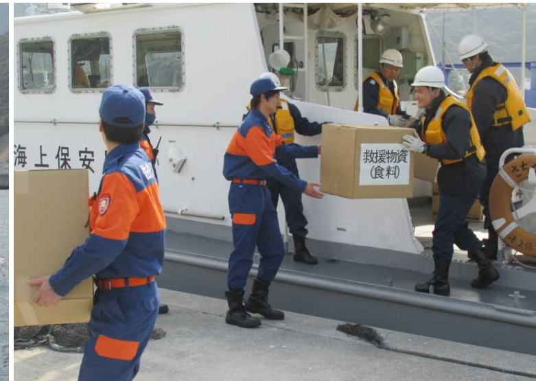
○孤立地区への海からの物資搬送訓練