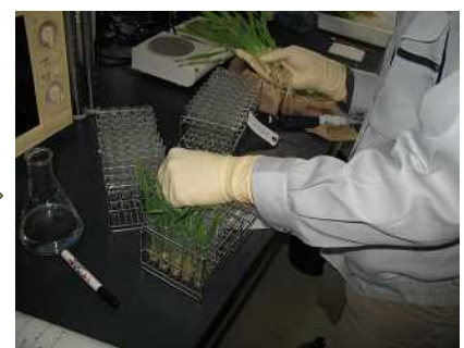
コルヒチン処理:倍加