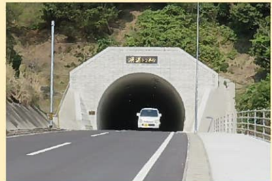
大泊浜徳浦線 深江工区（臼杵市）