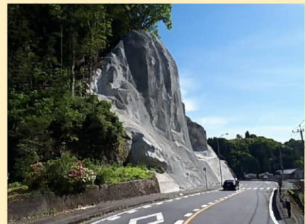
竹田直入線 植木工区（竹田市）