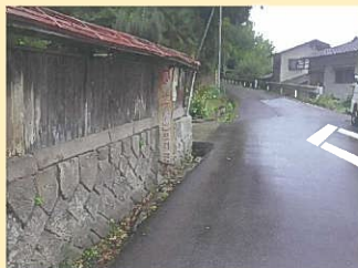
県道 日田山国線（日田市）