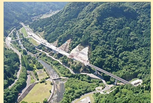
整備の進む耶馬溪道路（山移工区）