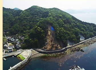
県道 四浦日代線（津久見市）