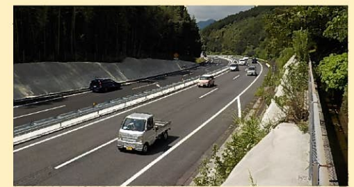
4車線区間を延伸した大分空港道路