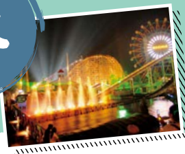
城島高原パーク きじまこうげん