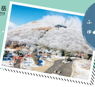
鶴見岳 つるみだけ