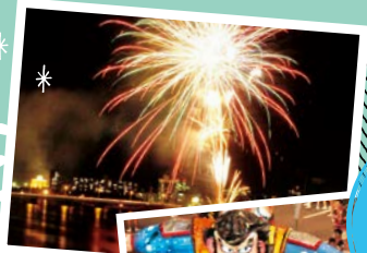
大分七夕まつり・納涼花火大会 おおいち たなばた のうりょう はなび たいかい