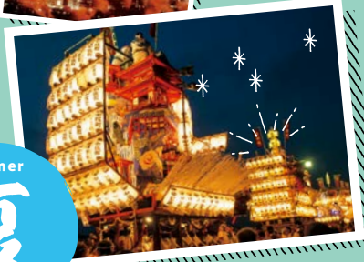
日田祇園祭 ひた ぎおん さい