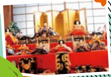
城下町佐伯ひなめぐり じょうかまち さいき