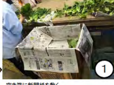
空き箱に新聞紙を敷く