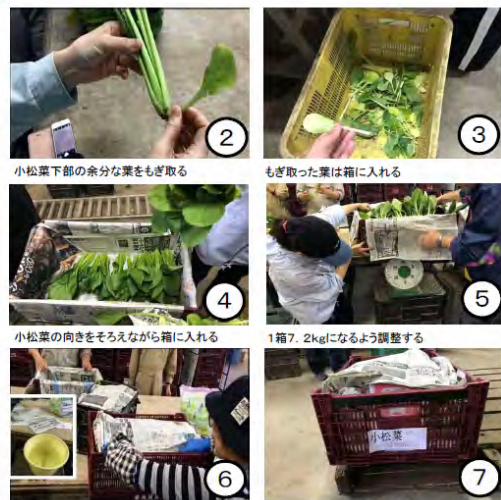
小松菜下部の余分な葉をもぎ取る