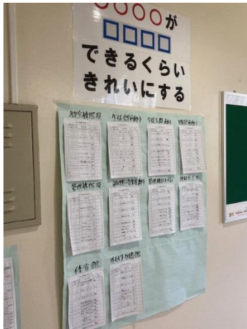
掃除の取組を振り返る