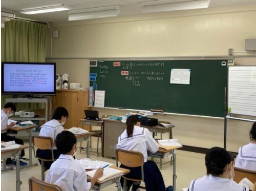
英語科の授業⇒例文を拡大