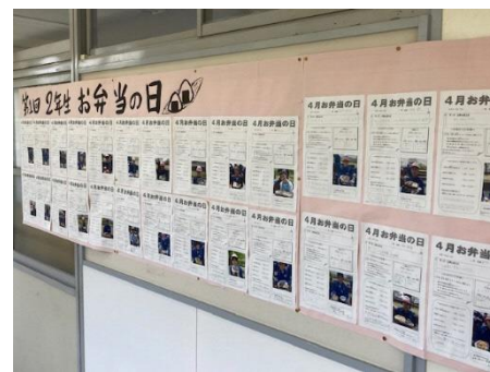
お弁当の日の取組