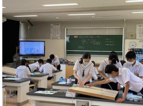
理科⇒デジタル教科書を投影