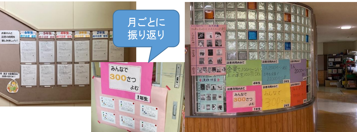
親子読書の取組、各学年で読書数の『めあて』の設定

2. 読書活動の充実として、親子読書の取組について掲示物が見られました。親子読書についての感想が記入されていました。児童は、お家の方から声かけをしてもらうことで、自分自身の読書活動を振り返り、さらに多くの本を読もうとする意欲の高まりに繋がる取組になっていました。また、読書促進の工夫として、月間の『めあて』を記入した掲示物が見られました。月ごとでの振り返りの実施で、次月への目標設定や取組が明確になっていました。