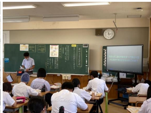
3年 道徳 ⇒ 中心発問提示