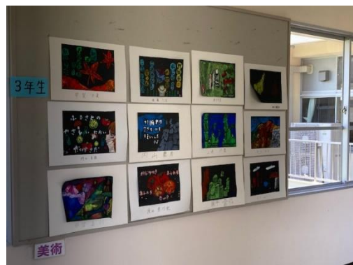
美術科作品やSDG'sについての生徒作品