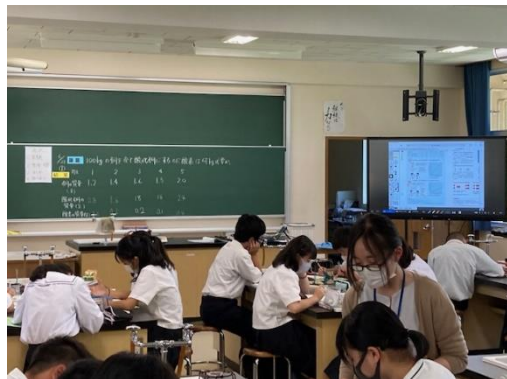
2年 理科 ⇒ デジタル教科書