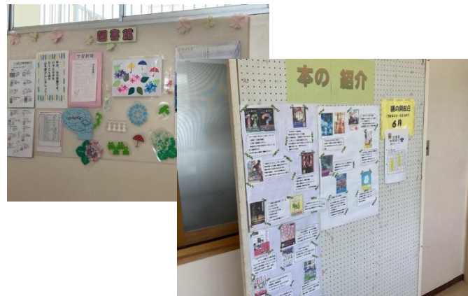
図書館活用の推進