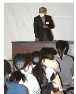
名誉団長(県知事)訪問