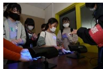
香々地ミステリー(手洗いミッション、てんびんバランスミッション)