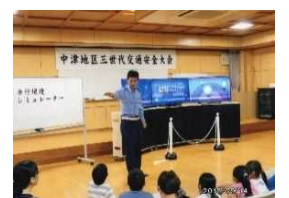
三世代交流交通安全教室