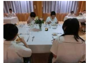
テーブルマナー教室の様子