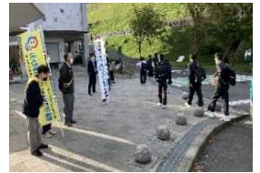
あいさつ運動の様子

「テーブルマナー教室」では新中学生を対象に、ナイフ、フォークの使い方など、本格フランス料理を頂きながら学びます。コロナ対策として公民館の広い会場と調理室を借り、2mの間隔を取る席の配置など、密にならないよう対策を行い実施しました。使い慣れないナイフやフォークに戸惑いながらも、華やかな料理に目を輝かせていました。