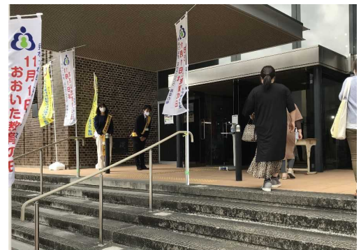
あいさつ運動(「おおいた教育の日」推進大会)

あいさつは人と人をつなげる大事な出会いの言葉です。あいさつ運動を通して子どもたちの社会性を育み、子どもたちは地域で守り育てるという意識の高揚を図るため、毎月第3金曜日の「青少年の日」を中心に県下であいさつ運動を行っています。