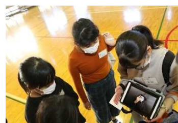
タブレットを使ったミッション

参加者には、コロナ渦の中、感染防止に気をつけながらも、主体的に活動し、協働できた学びの成果を各地で発揮するように期待しています。