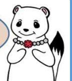
更生女性会員のオコジョさん 更生保護キャラクター