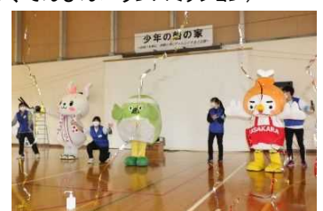
ファイナルパーティー