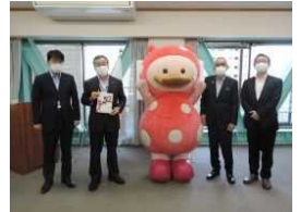
防犯ブザー贈呈式