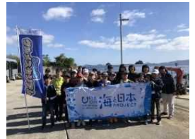
Sea級グルメスタジアム

大分放送では、青少年の知識や理解力を高め、情操を豊かにする番組「歩こうおおいチャレンジ100キロ」や、「Sea級グルメスタジアム」等の事業を青少年向けに展開しています。しかし、今年度はコロナ禍で多くの番組や事業が中止や延期、縮小に追い込まれました。その中でも、2013年の創立60周年を機に、子供たちの笑顔を地域で守りたいというテーマでスタートした「ハッピーキッズキャンペーン」は、今年度も継続しています。コロナ禍で生産が遅れはしましたが、今年も大分県の小学校の新1年生全員約9500人に、OBSのキャラクターである「まるんちゃん♪」の防犯ブザーを贈呈することができました。また、県内の養護施設に寄付金を贈り、そのお金は養護施設を出る子供たちの祝い金や進学の際の奨学金として活用されています。