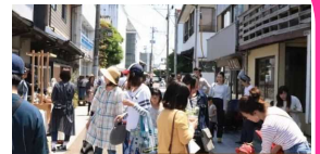
船頭マチイチの様子